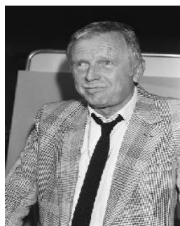
Toon Hermans, Nederlandse cabaretier, zanger, dichter en kunst- schilder (1916-2000)

Ik zag hen angstig beven, in donker en in licht en zie mijn eigen leven in hun verveerd gezicht.