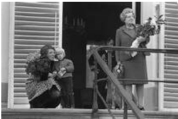
Koningin Juliana, Prinses Beatrix en Prins Willem-Alexander op het bordes van Paleis Soestdijk tijdens de aubade van een kapel uit wintersportoord Lech.

In mijn jeugd in Bussum begon het Koninginnedagprogramma altijd met een aubade bij het stadhuis. Ik ben er nooit bij geweest maar ik vind het wel een mooi woord. Wikipedia zegt ervan: Een aubade is het toezingen van een geliefde of een vorst in de vroege morgen. Een typisch Nederlandse traditie is een aubade op Koninginnedag, waarbij het volk de koningin toezingt. In het algemeen treedt de plaatselijke burgemeester als vertegenwoordiger van de koningin op.