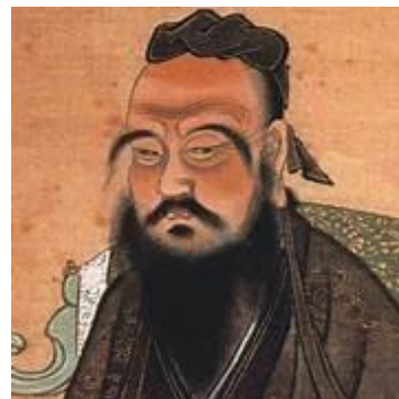
Confucius, Chinees filosoof (551-479 v.Chr.)

Onze grootste overwinning is niet dat wij nooit falen, maar dat wij telkens als wij struikelen, weer opstaan.