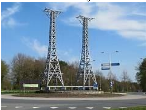
Het Phohi-monument in Huizen.